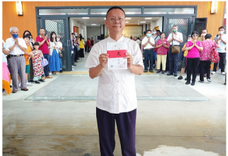
恭焚『修行大道停看聽』