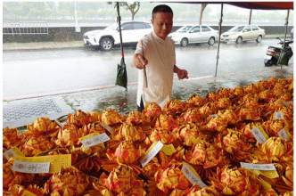
觀世音菩薩教化紙人過運之景