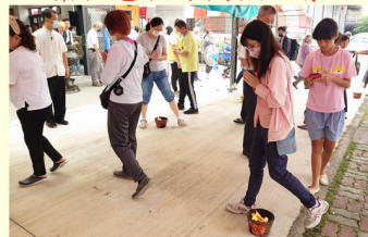
善信過七星火之景