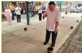
關聖帝君開教七星火