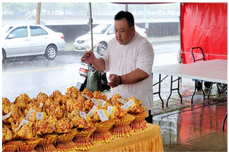
地藏菩薩、濟佛教化紙人過運之景