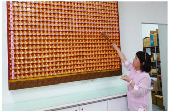
九天恩師開教法會點燈，加持煙供、藥供包之景