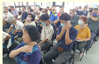
藥供包祛除病煞之景