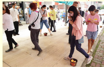
善信過七星火之景