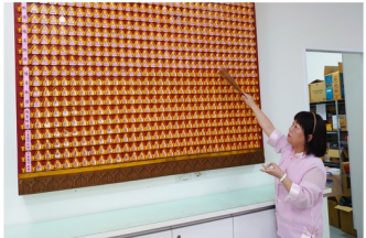
九天恩師開教法會點燈，加持煙供、藥供包之景