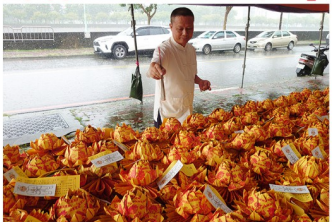
觀世音菩薩教化紙人過運之景