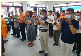
善信虔心獻果之景