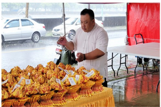
地藏菩薩、濟佛教化紙人過運之景