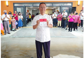
恭焚『修行大道停看聽』