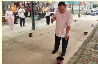
關聖帝君開教七星火