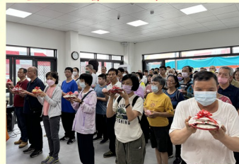
善信虔心獻果之景